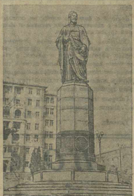
Баку. Памятник азербайджанскому поэту-мыслителю Низами Гянджеви.

Недавно в Армении вступил в строй Туманянский завод огнеупоров. Предприятие оснащено передовой техникой. Почти все производственные процессы механизированы. Сырьевые ресурсы Туманянского завода значительны и пригодны как для производства огнеупоров, так и для керамической промышленности. С пуском нового завода промышленность как Армении, так и Грузии и Азербайджана будет полностью обеспечена высококачественными огнеупорами.