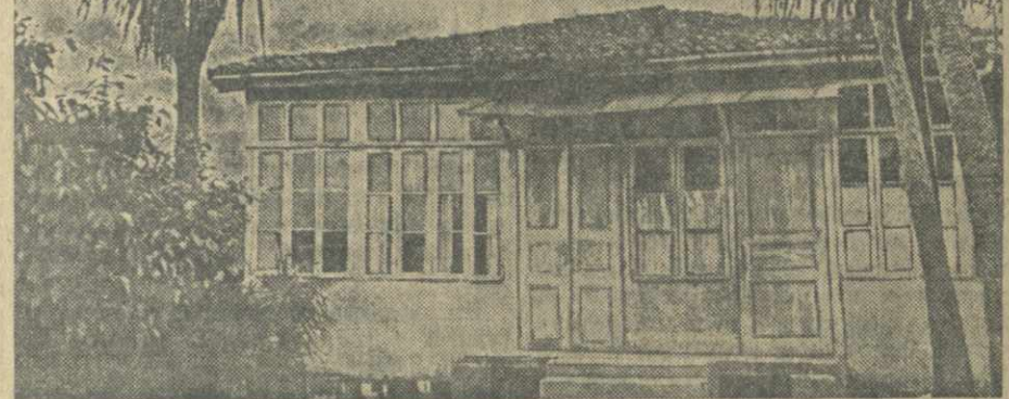
«ВЕЛИКИЙ СТАЛИН» ВОЖДЬ ВКП(б) И МИРОВОГО ПРОЛЕТАРИАТА В ЭТОМ ДОМЕ УСТРАИВАЛ МАССОВЫЕ ПОЛИТИЧЕСКИЕ СОБРАНИЯ РАБОЧИХ БАТУМСКИХ ЗАВОДОВ, ПРОВОДИЛ ЗАНИМАНИЯ С СОЦИАЛ-ДЕМОКРАТИЧЕСКИМИ РАБОЧИМИ КРУЖКАМИ В 1901—1902 гг.