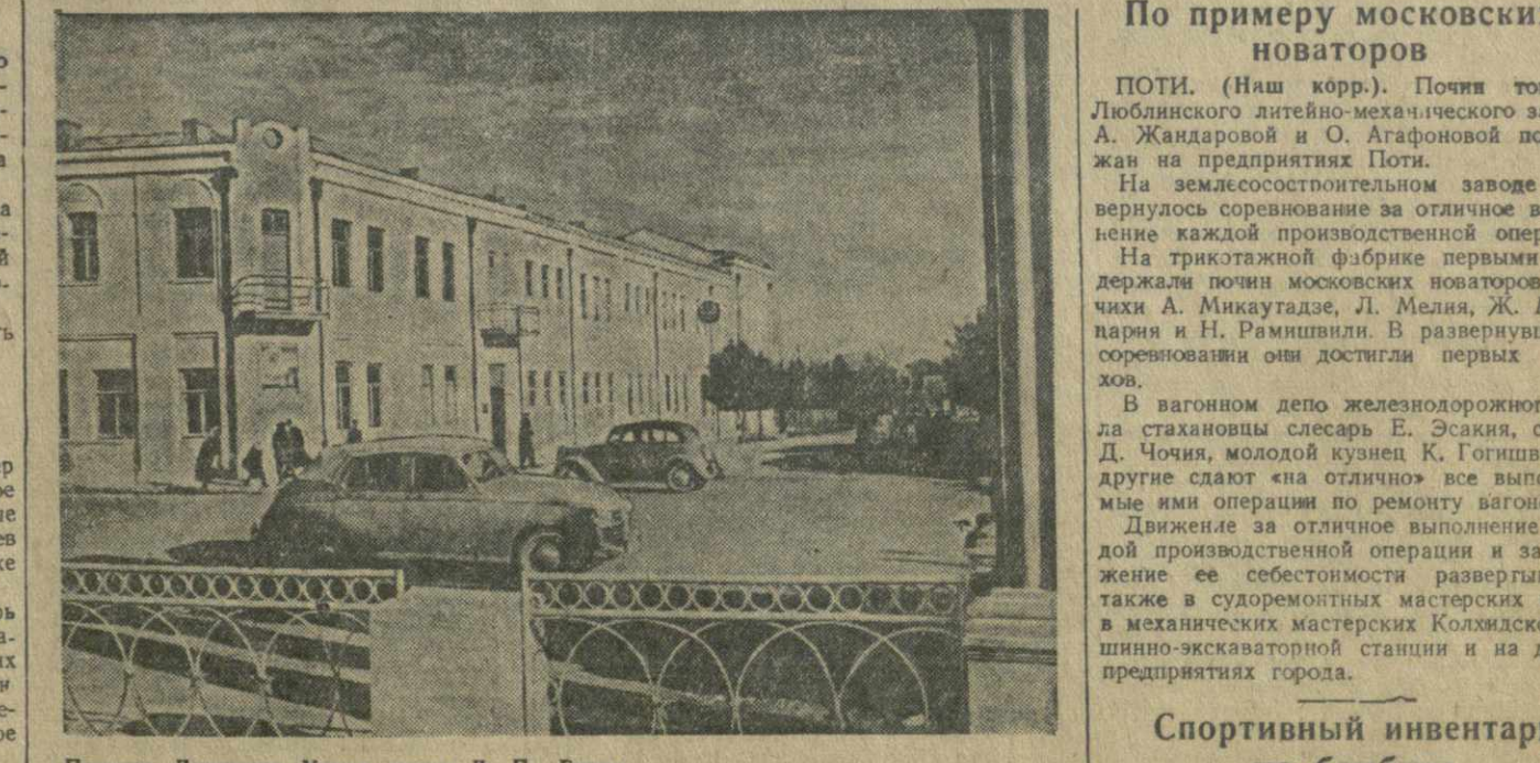
Поселок Ланжухи. Улица имени Л. П. Берия.