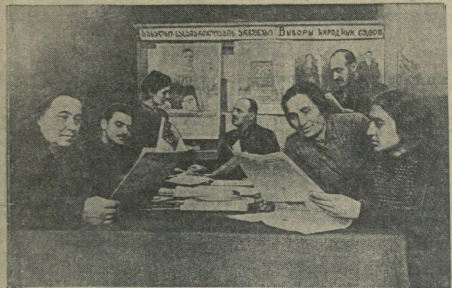
25-й избирательный пункт района им. Берия города Тбилиси. На снимке: избиратели в комнате агитколлектива читают газеты и журналы.

На днях в Батумском доме учителя состоялась многолюдная встреча избирателей с кандидатом в народные судьи первого участка города Батуми тов. С. Сирадзе.