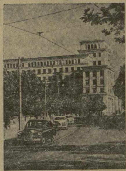
На снимке: Тбилиси. На улице Ленина.