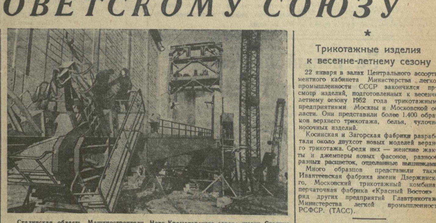
Сталинская область. Машиностроительный завод имени Сталина изготовил сверхмощный экскаватор с ковшем емкостью 15 кубометров.

Трикотажные изделия к весенне-летнему сезону