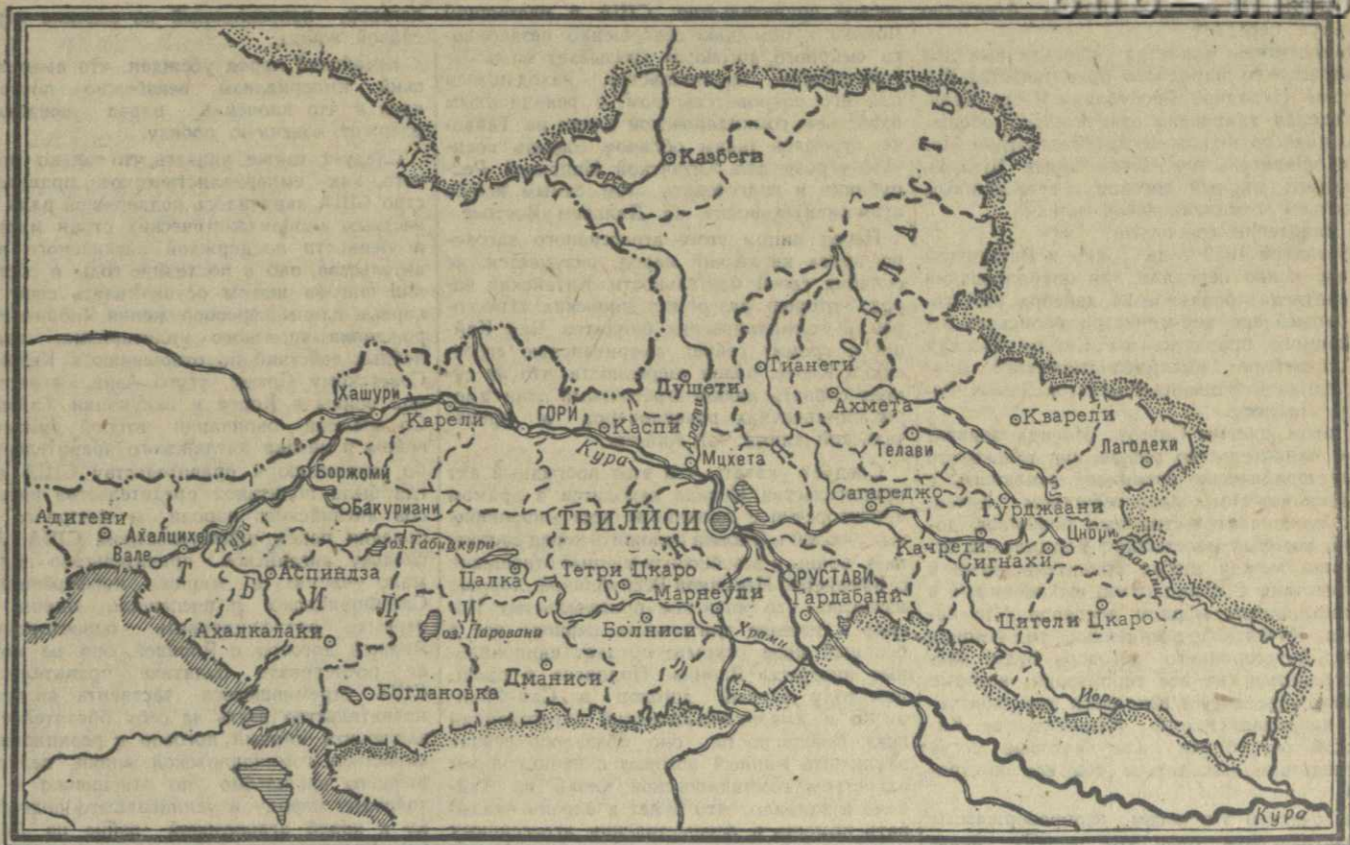
КАРТА ТБИЛИССКОЙ ОБЛАСТИ