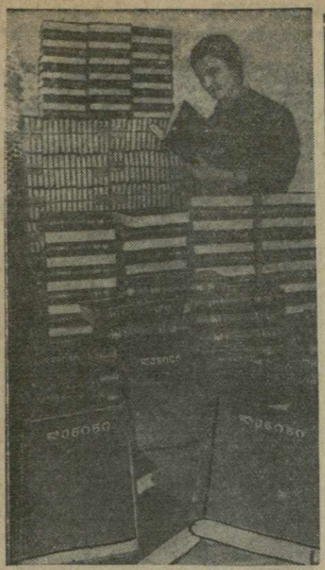
Тбилиси. В типографии №1 Грузполиграфиздата печатается на грузинском языке 25-й том Сочинений В. И. Ленина.

23 января под председательством академика А. Н. Несмеянова состоялось пленарное заседание Комитета по Сталинским премиям в области науки и изобретательства при Совете Министров СССР.