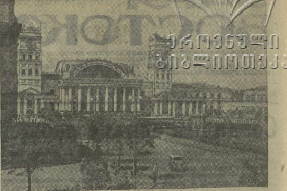
Украинская ССР. 23 августа исполнилось 10 лет со дня освобождения Харькова от немецко-фашистских захватчиков. За это время в городе выросла новая кварталы благоустроенных жилых домов, построено много красивых зданий административных и культурно-бытовых учреждений. На снимке: привокзальная площадь в городе Харькове.

Потийский рыбозавод и рыбоделательный цехоз «Болхиза» за 8 месяцев текущего года выполнили свыше четверти годового плана. И тем не менее у завода и цехоза имеются большие неиспользованные резервы для увеличения добычи рыбы.