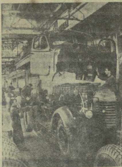
Кутанский автозавод. На снимке: главный конвейер цеха автосамосвалов

Партия не изжила до конца проблемы в проверке исполнения принятых постановлений. В мае этого года на районной партийной конференции отмечалось, что за отчетный период из 316 обсужденных на заседании бюро райкома вопросов проверено только 3.