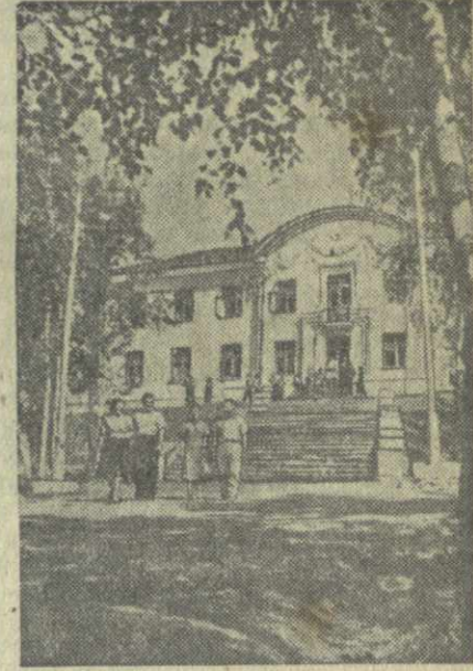
Челябинская область. В Чебаркульском районе в этом году открылся дом отдыха центрального комитета профсоюза угольной промышленности.

В Москве открылся новый вуз — Высшая школа промышленной кооперации. На три факультета зачислены 160 человек.