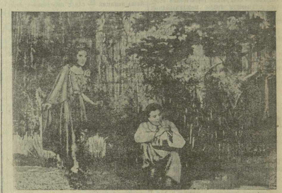
Сцена из спектакля «Лесная песня».

Образ Улдаса дается артистом в развитии. Если вначале на сцену, подобно вихрю, врывается буйный удалец, готовый пошутить и побалагурить, то к концу спектакля перед нами — человек, возмужавший, многое увидевший по-новому, но утративший былую лихость,