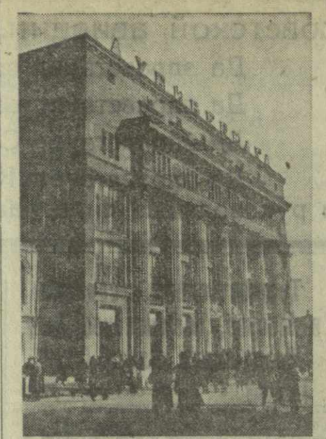
Горький. В специально выстроенном здании открыт новый универсам. Это самое крупное в городе торговое предприятие. Магазин имеет более 30 секций, в которых работают около 200 продавцов. В первый день торговли горьковчане приобрели различных товаров на 1 миллион 250 тысяч рублей.

Советский народ вполне может полагаться на свою армию, авиацию и флот. Он может быть уверен, что Вооруженные Силы СССР сумеют дать сокрушительный отпор любому агрессору, который осмелится развязать войну против великой Страны социализма.