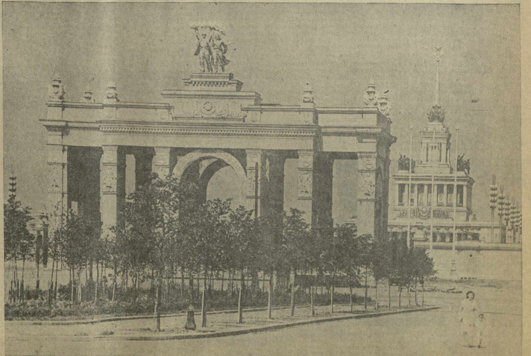
Москва. Всесоюзная сельскохозяйственная выставка. Главный вход.