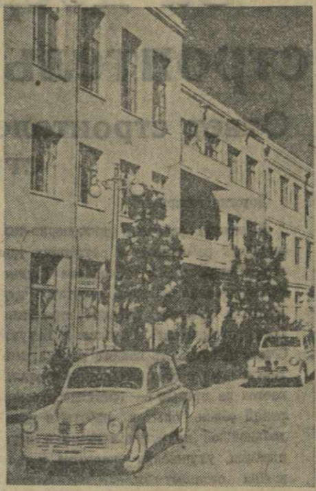
Гор. Цхакая. На улице Ленина.

Собрание партийного актива приняло резолюцию, призывающую партийные организации еще выше поднять партийно-политическую и разностороннюю работу среди трудящихся, шире развращавать большевистскую критику и самокритику, как могучее средство борьбы за охрану социалистической собственности и укрепление советской законности.