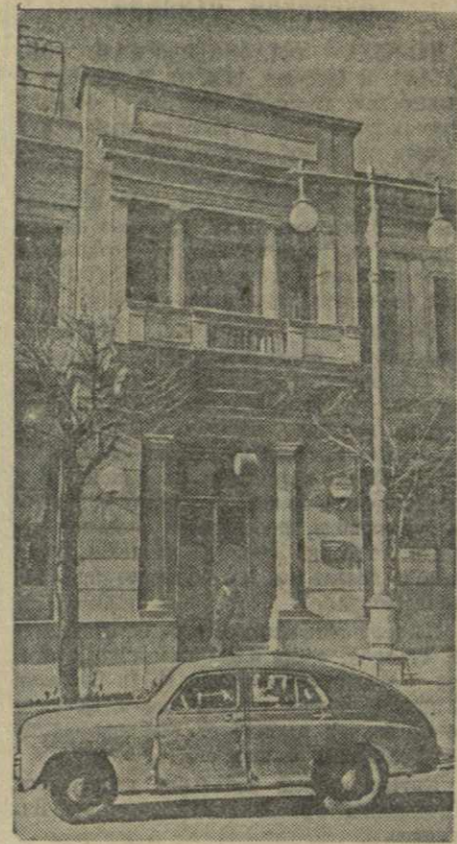
Гори. У входа в гостиницу.