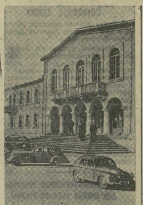
Административный дом в районном центре Тергола.

Сессия обсудила также некоторые организационные вопросы.