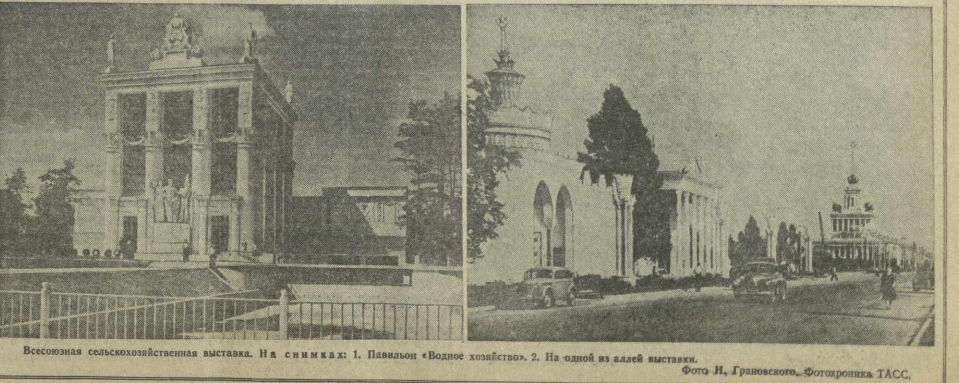
Всесоюзная сельскохозяйственная выставка. На снимках: 1. Павильон «Водное хозяйство». 2. На одной из аллей выставки.

Выставка имела большой успех. За месяц ее посетили свыше полумиллиона москвичей и приезжих.