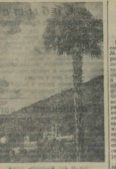
Гагра. Санаторий нефтяников.

КВТАИСИ (Наш корресп.). Для обслуживания колхозников в дни полевых работ при районном Доме культуры организована агитационно-художественная бригада.