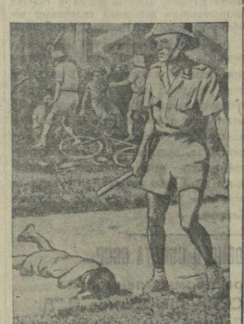
Вьетнам. Самоотверженно борется вьетнамский народ за свою свободу и независимость. Правительство демократической республики Вьетнам удерживает в своих руках свыше 90 процентов территории. В городах, захваченных французскими колонизаторами, господствуют террор и угнетение. На снимке: зверская расправа французской полиции с демонстрантами в Сайгоне.

Я ненавижу мысль о войне, о том дне, когда была сброшена атомная бомба. Когда я читаю книги, то пропускаю те места, где говорится о войне; и когда мне приходится видеть в кино сцены из войны в Корею, я вся дрожу. Я пишу сейчас эту работу потому, что учитель велел нам ее написать, но я не люблю вспоминать о том, что я сейчас расскажу. Утром 6 августа 1945 года за мной старшим братом зашел один его товарищ, чтобы вместе идти в школу. Мой брат ушел во втором классе начальной школы. Мне было тогда пять лет, а мой старший брат — два года. Я с ней играла в саду. Папа обычно уходил на службу в восемь часов, но как раз 6 августа должен был пойти в половине девятиго. Он сидел у окна и что-то писал, мама убирала со стола. Вдруг высоко в небе я услышала гул самолета... Потом я увидела белое пламя, и все деревья в саду стали вдруг какие-то серые, словно умерли. Я закричала: «Папа!» — и побежала домой. Вдруг раздались страшный треск. Вся мебель, полки с книгами, ящики упали друг на друга;