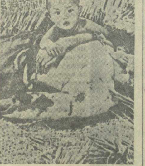
Корея. Американские интервенты бесчеловечно бомбят города и деревни Кореи, убивают мирных жителей. Воздушные пираты расстреливают из пулеметов крестьян на полях, путников на дорогах, детей, возвращающихся из школ. На снимке: зверское преступление, совершенное американскими воздушными бандами. Ребенок у тела убитой матери.

МАО ДУНЬ, председатель Союза китайских писателей. («В защиту мира», май 1952 г.).