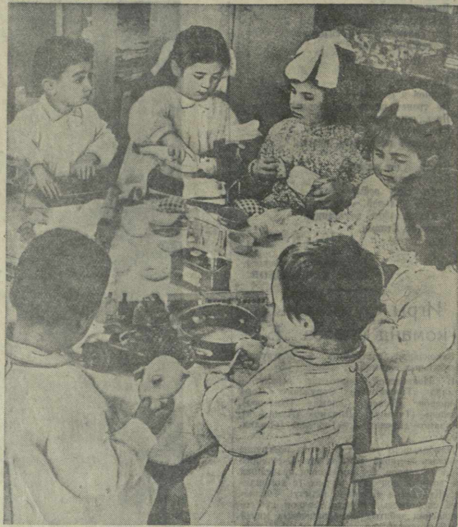
Дети работниц Телавской шелкоткацкой фабрики весело проводят день под присмотром опытных воспитателей. На снимке: старшая группа воспитанников детских яслей.

Г. УРИДИЯ, секретарь ЦК ЛКСМ Грузии по работе среди школьной молодежи и пионеров.