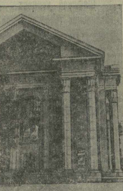
Новый кинотеатр «Победа» в г. Вильнюсе. Фото В. Пушкарева.

Чтобы успешно решить эту задачу, необходимо повысить уровень всей партийно-политической работы. Важнейшим средством улучшения работы партийных комитетов и хозяйственных организаций является хорошо налаженная проверка исполнения. Она помогает в любое время выяснять состояние работы аппарата, разоблачать нарушения партийной и государственной дисциплины, во-время вскрывать и устранять ошибки и недостатки в работе.