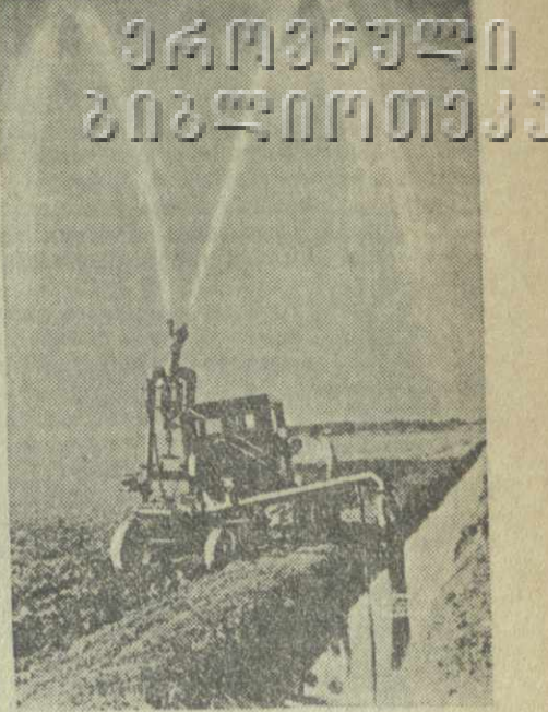
Московская область. На полях колхоза «Вперед к коммунизму» Раменского района работает новая машина Всесоюзного научно-исследовательского института сельскохозяйственного машиностроения—дальноходная дождевальная установка «ДДП-30». Производительность ее—30 литров воды в секунду, радиус орошения—60 метров. На с ним к с: новая дождевальная установка «ДДП-30».

Важнейшая задача поставлена перед комсомолом в приветствии ЦК КПСС XII съезду ВЛКСМ—обеспечить еще более активное участие комсомольцев и всей советской молодежи в государственном, хозяйственном и культурном строительстве, во всей общественно-политической жизни страны. Верный идеям марксизма-ленинизма, комсомол является надежным резервом и помощником Коммунистической партии. (ТАСС).