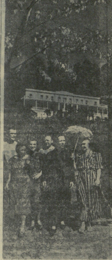
Бауми, Зеленый Мыс. Отдыхающие в доме отдыха Грузинского политического института направляются на прогулку.

Основа основ большевистской бдительности является коммунистическая идея, принципиальность, умение разбираться в политических событиях. Тот, кто ясно понимает, что такое капиталистическое окружение, что отдаст себе отчет в том, что пока капиталистическое окружение существует, разведывательные органы иностранных государств будут засылать в наши тылы вредителей, диверсантов, шпионов, — тот не поддается настроениям