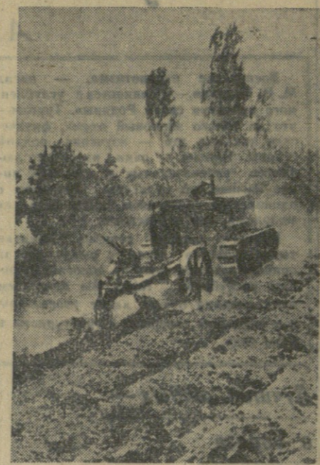
С освоение новых земель в колхозе имени С. Орджоникидзе села Бамбакшат Охтембергского района Армянской ССР.

В РЕСПУБЛИКАХ ЗАКАВКАЗЬЯ СМОТР ТВОРЧЕСТВА АШУГОВ Азербайджанский Дом народного творчества и Комитет по делам культурно-просветительных учреждений организовали просмотр творчества ашугов и танпоров. Смотр состоялся в городе Кировабаде, в парке культуры и отдыха имени В. И. Ленина. В нем приняло участие до 200 народных певцов, приехавших из Актавского, Таузского, Шахморского, Келабского, Нухинского и других районов Гянджинской области. Большой успех имели у слушателей песни и сказания ашугов, посвященные любимому вождю народов товарищу Сталину, великим стройкам коммунизма, борьбе за мир, счастливой колхозной жизни.