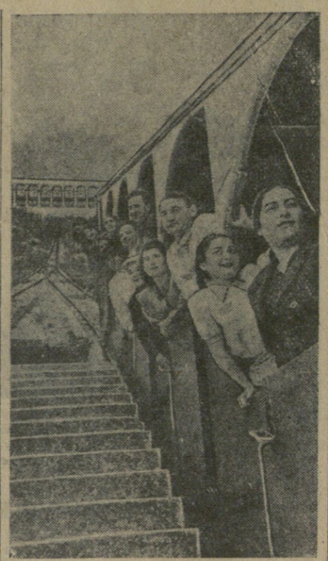
Круглый год работает парк культуры и отдыха имени Сталина. Особенно оживленным парк бывает летом. В него можно поехать по благоустроенной автомобильной магистрали и в вагоне канатной железной дороги, пролетающей по склону Мтацминды. На снимке: пассажиры в вагоне канатной железной дороги.

Постановка Г. УМЯКЦА Художник Р. НАБА Д. Н. Музыка А. ТИРАНИАНА, введ. деят. вост.