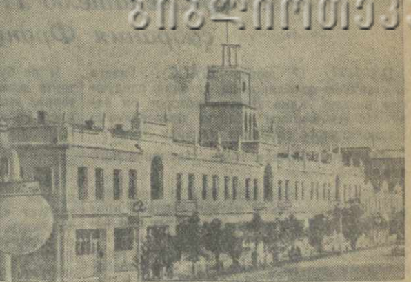
Поти сегодня. Новый жилой дом на проспекте имени Руставели.

В одном из горных уголков Кутаисской области возник еще до войны рабочий поселок. Носит он название Урава. Название осталось от села, жители которого несколько лет назад переселились в район возделывания цитрусовых культур. Административные органы считают Ураву по-прежнему селом, но это — рабочий поселок. Министерство торговли Грузинской ССР своим письмом от 17 января нынешнего года в ответ на просьбу включить Ураву в число рабочих поселков, ответило, что Урава является селом и в его списках не значится. Поселок заслуживает большого внимания областных и республиканских организаций. Здесь нет кино, радио, детям приходится ходить в среднюю школу за несколько километров. Г. Дедух.