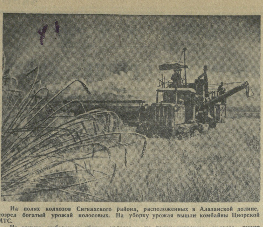
На полях колхозов Сигнальского района, расположенных в Алазской долине, созрел богатый урожай колосовых. На уборку урожая вышли комбайны Цюорской МТС. На снимке: выборочная уборка колосовых на полях цюорского колхоза имени Руставели.

ОИП. 16 июня. (ТАСС). В Туа-Муонской долине, расположенной в предгорьях Алазского хребта, созрели хлеба. Колхозы имени Ленина, имени Сталина приступили к уборке зерновых.