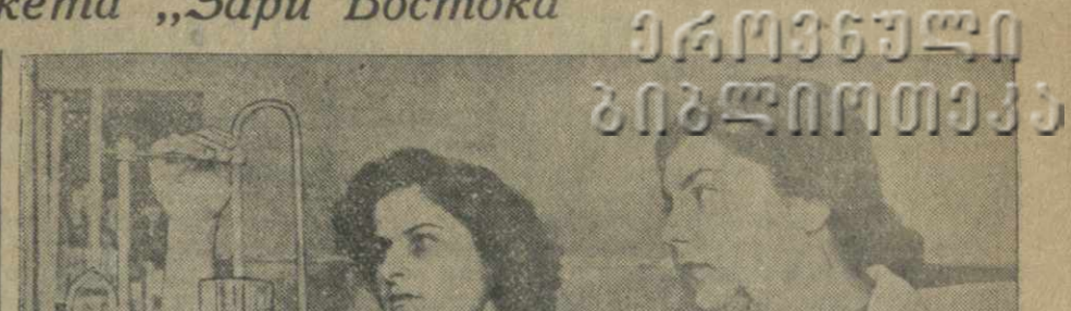
Анкета „Зари Востока“

В Советской Грузии более десяти тысяч человек заочно учится в высших учебных заведениях страны. Среди них — горняки, токари и машинисты, бригадиры и председатели колхозов, советские служащие. Сейчас у заочников — пора экзаменов. Ниже мы помещаем анкету «Зари Востока», рассказывающую об учебе и творческих планах студентов-заочников.