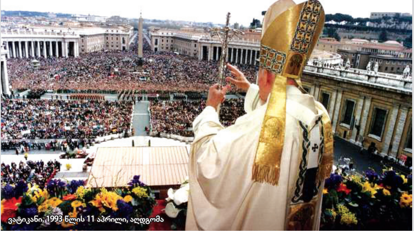
ვატიკანი, 1993 წლის 11 აპრილი, აღდგომა

1993 - ახალი პრეზიდენტების წელი: ბილ კლინტონი (აშშ), ეზერ ვაიცმანი (ისრაელი), ძიანგ ზემინი (ჩინეთის სახალხო რესპუბლიკა), მაჰამან უსმანი (ნიგერია), ალბერტ ზაფი (მადაგასკარი), დინგირი ბანდა ვიჯეტუნგა (შრი ლანკა), ხუან კარლოს ვასმოსი (პარაგვაის პირველი პრეზიდენტი 40 წლის შემდეგ); სამხედრო გადატრიალების შემდეგ ჰეიდარ ალიევი ხდება აზერბაიჯანის პრეზიდენტი, ნოროდომ სიანუკი კვლავ ხდება კამბოჯის მეფე; ეს ტერაქტების წელია იტალიაში, მილანში, ფლორენციაში, რომში თავს დაესხნენ ლატერანის ბაზილიკას (Basilica di San Giovanni in Laterano) და ველაბროს წმ. გიორგის ბაზილიკას (San Giorgio al Velabro), პალერმოში მოკლეს მღვდელი პინო პულიეზე, მაფიის დაუძინებელი მტერი; მანჰეტენზე, მოგადიშოზე (სომალი) და ბომბეიში თხუთმეტი ბომბი აფეთქდა სამ საათში, მუსლიმებსა და ინდუსებს შორის რელიგიური შეტაკებების დროს დაიღუპა ორასზე მეტი და დაიჭრა ათასზე მეტი ადამიანი; ამ წელს შეწყდა ცეცხლი და დაიდო ხელშეკრულება ერაყში, ბოსნიაში, ისრაელსა და პალესტინის განთავისუფლების ორგანიზაციას შორის; ვატიკანსა და ისრაელს შორის; მათ შორის, ბირთვული განიარაღებისათვის, ასევე, განხილულ იქნა რა-