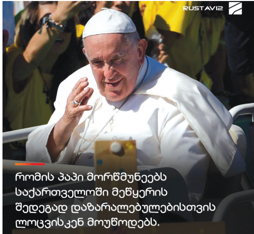
რომის პაპი მორწმუნეებს საქართველოში მენყერის შედეგად დაზარალებულებისთვის ლოცვისკენ მოუწოდებს.

1-ელ აგვისტოს, ჰუმანიტარული დერეფნის გავლით, ევროპაში, ამჯერად რომში, ავღანეთის ოცდაორი მოქალაქე, მათ შორის, ხუთი არასრულწლოვანი ჩავიდა. მათ განთავსებაზე კათოლიკე ეკლესია ზრუნავს. იტალიის ეპისკოპოსთა კონფერენციისა და მთავრობის შეთანხმებით, კათოლიკე ეკლესია სამას ავღანელ ლტოლვილს მიიღებს. ასე ადამიანი უკვე იტალიაშია, დანარჩენები თავის ჯერს ელიან სატრანზიტო ქვეყნებში, სადაც მათ ადგილობრივი კათოლიკური სამრევლოები ეხმარებიან.