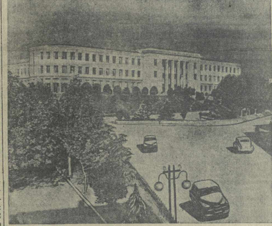
Дом Советов в городе Сталинири.