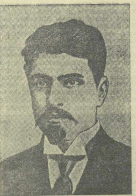
путь, на позиции ленинизма и остался им верен до конца своей жизни.

Эта встреча произвела огромное впечатление на молодого революционера. Он бесповоротно стал на большевистский