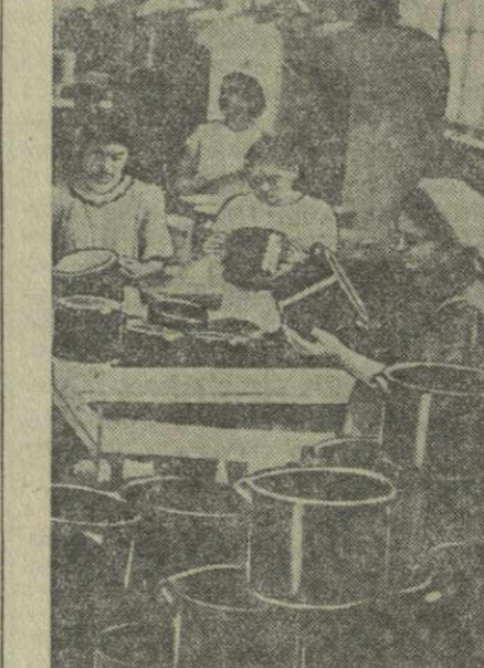
Тбилисский завод «Грузмаллпосуда». На снимке: готовая продукция проверяется перед отправкой в торговую сеть.