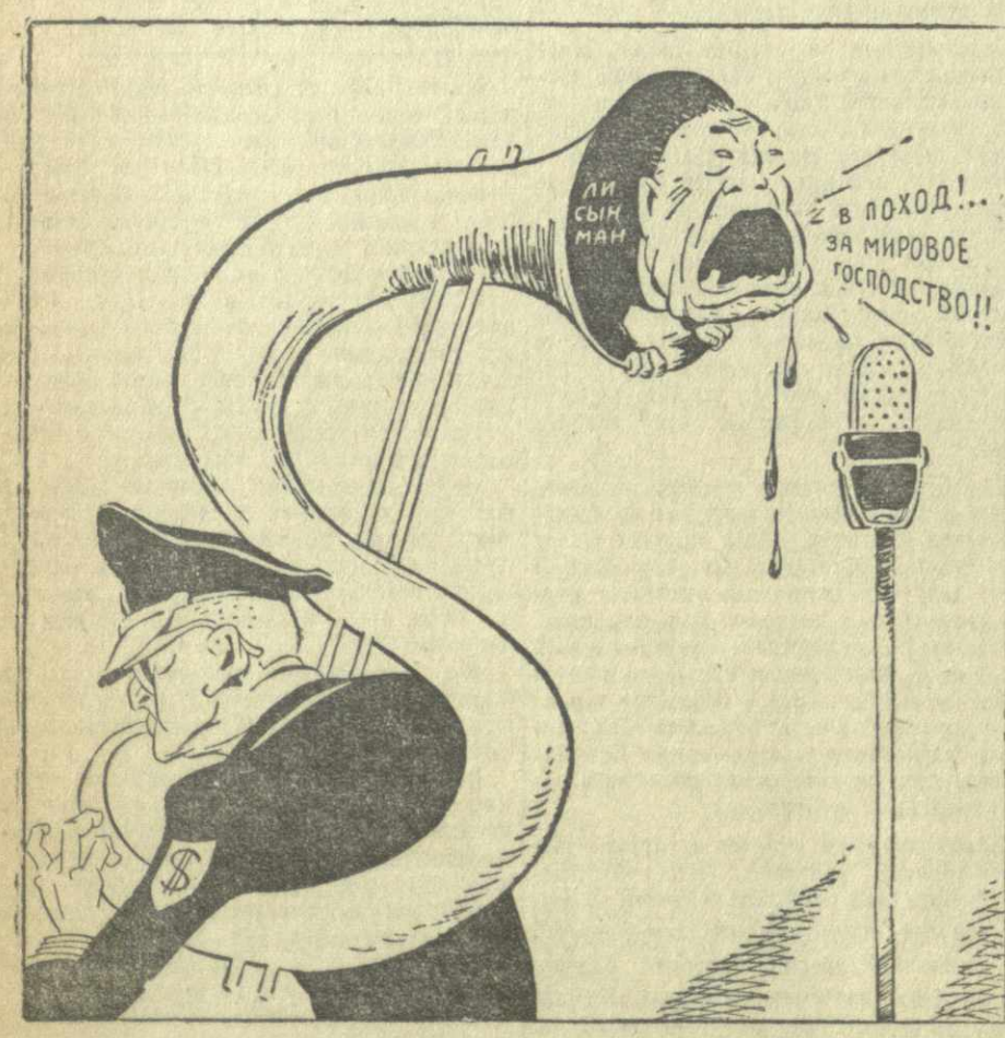
Голос и подголосок

Поощряемый определенными американскими кругами, Ли Сын Ман выступил в США с наглой поджигательской речью. (Из газет).