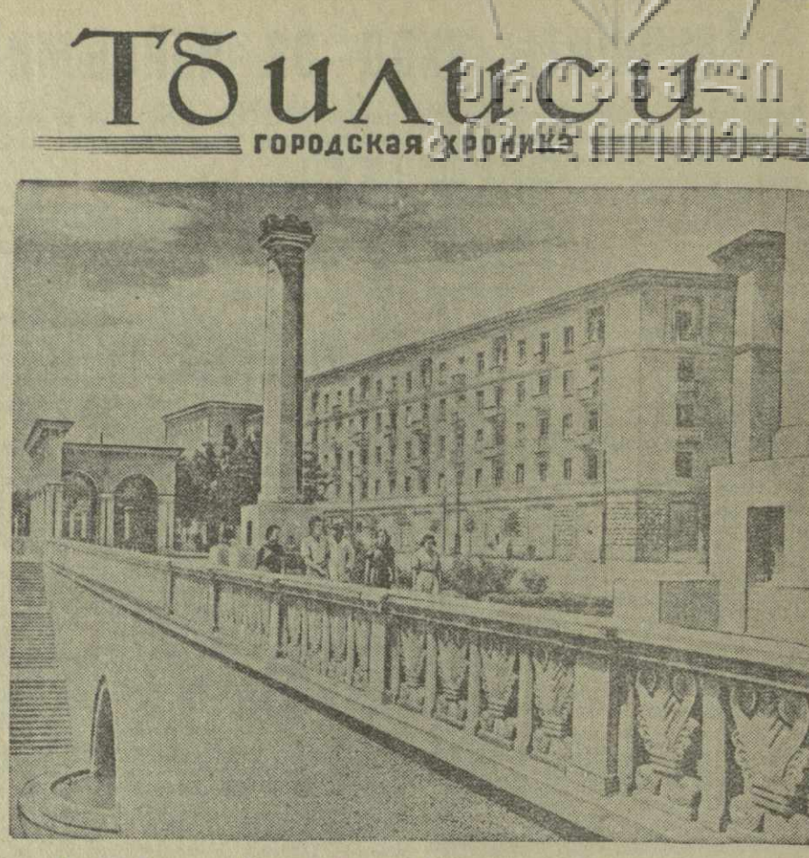
Тбилиси сегодня. Новые дома на Университетской улице.

После торжественного парада победителям были вручены альфы чемпионов, а представителям спортивного общества «Динамо» — переходящий приз Комитета по физической культуре и спорту при Совете Министров Союза ССР. (ТАСС).