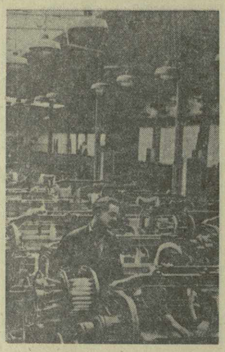
Литовская ССР. Ткацкий цех Клайпедской хлопчатобумажной фабрики, оснащенный новейшими отечественными станками.

Комбайновая уборка хлебов в районе заканчивается. Тов. Ртвелишвили напомнил организаторам комбайновой уборки важные, очередные их задачи — обеспечить молотью всего убранного зерна, вывозку с полей соломы и половы. Добиться, чтобы в сжатые сроки были полностью очищены семена. Подхватить и широко распространить инициативу передовых колхозов, вспахавших и посеявших на освободившихся землях кукурузу под силос. Обеспечить нахоту под посевы озимых. Только после выполнения всех этих работ можно будет сказать, что организаторы с честью выполнили свое и ответственное задание партии.