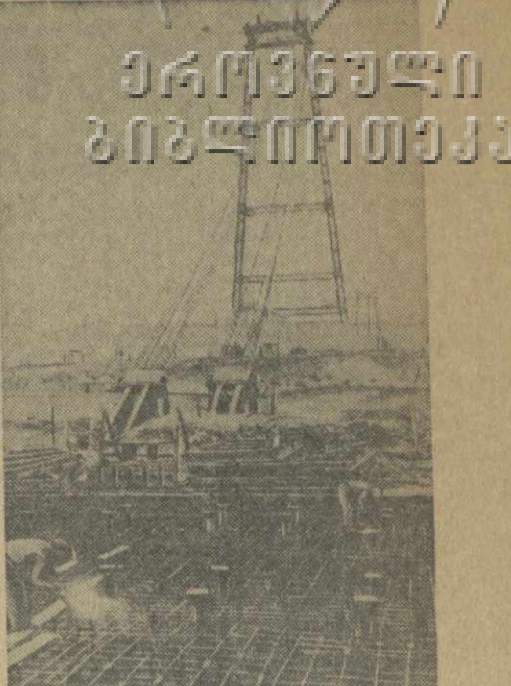
Сталинградгидрострой. Рядом с котлованом под здание ГЭС ниже по течению Волги идет сооружение четвертого ряда рисбермы. После окончания строительства станции рисберма скроется под водой.

В состав делегации ФИАИ, ФИПЕЗО и МФПРИ входят видные деятели учебного движения Франции, Англии, Швейцарии, Голландии, Бельгии, Чили, Италии, Дании, Китая, Индонезии, Германской Демократической Республики и СССР.