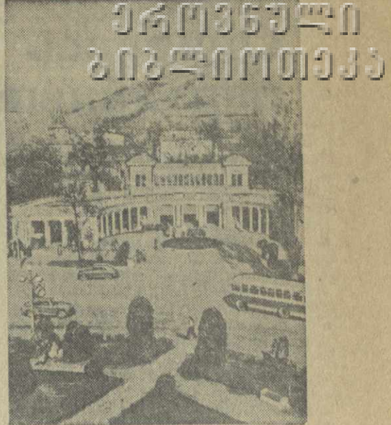
Кисловодск. Проспект имени Сталина.

Уже об руку с бетонщиками трудятся работники экспедиции гидроэлектростанции. Их задача состоит в том, чтобы максимально укрепить коренные скальные породы, на которых покоится фундамент здания ГЭС, обеспечить образцовую гидроизоляцию. Перед укладкой бетона работники гидроэлектростанции устанавливают на всю толщину блока металлические трубы и затем, когда бе-