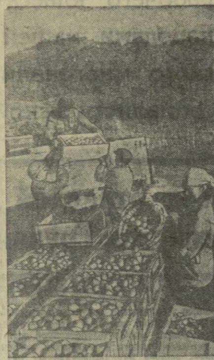
Отгрузка первых мандаринов в Цхиндзирском совхозе.