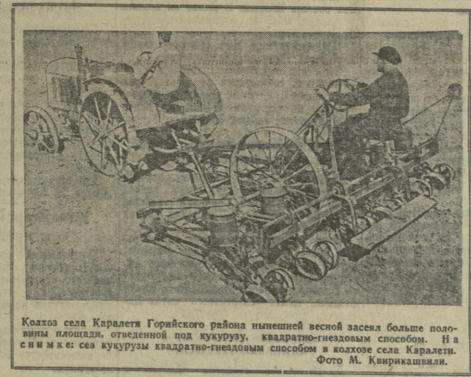
Колхоз села Каралети Горьковского района нынешней весной засеял больше половины площади, отведенной под кукурузу, квадратно-гнездовым способом. На снимке: сев кукурузы квадратно-гнездовым способом в колхозе села Каралети.