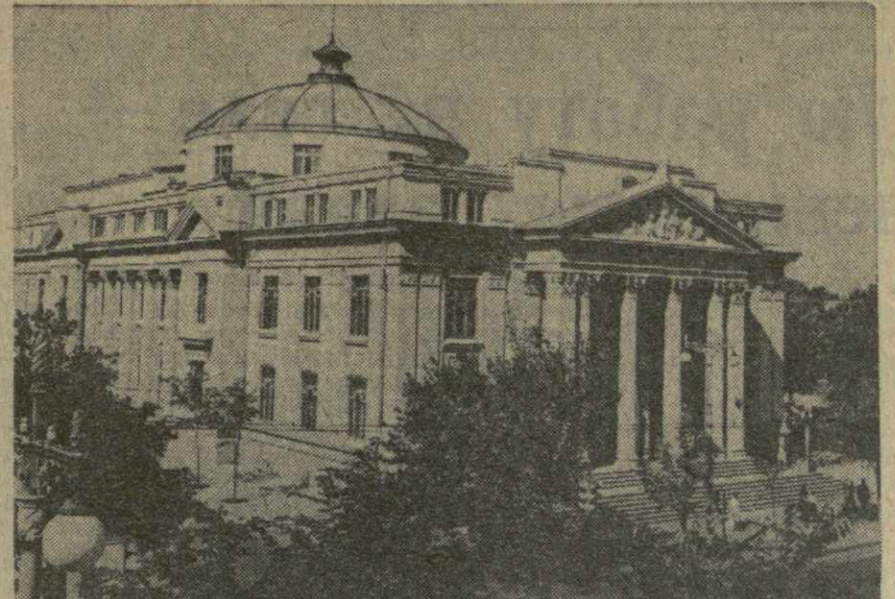
24 августа исполняется 10 лет со дня освобождения частями Советской Армии Молдавской ССР — Килишиева от гитлеровских захватчиков. За минувшие десятилетия в городе восстановлены и построены крупные предприятия легкой и пищевой промышленности, сотни новых жилых и административных зданий. В Килишиеве имеются пять высших учебных заведений, десятки средних и начальных школ. Большие успехи достигнуты в развитии искусства молдавского народа. В городе созданы Молдавский музыкально-драматический театр, театр русской драмы, государственная филармония и другие. На с снимке: здание Молдавского музыкально-драматического театра.

Хорошо произрастает это дерево в районе Джезказгана. В озеленении городов и поселков Центрального Казахстана оно находит все большее применение.