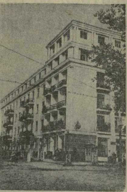
Брянская область. Быстро растет город Клычи. Здесь строятся большие жилые дома, клубы, школы, детские учреждения.

На снимке: 32-квартирный дом для рабочих завода имени Калинина на улице Пушкина в городе Клычи.