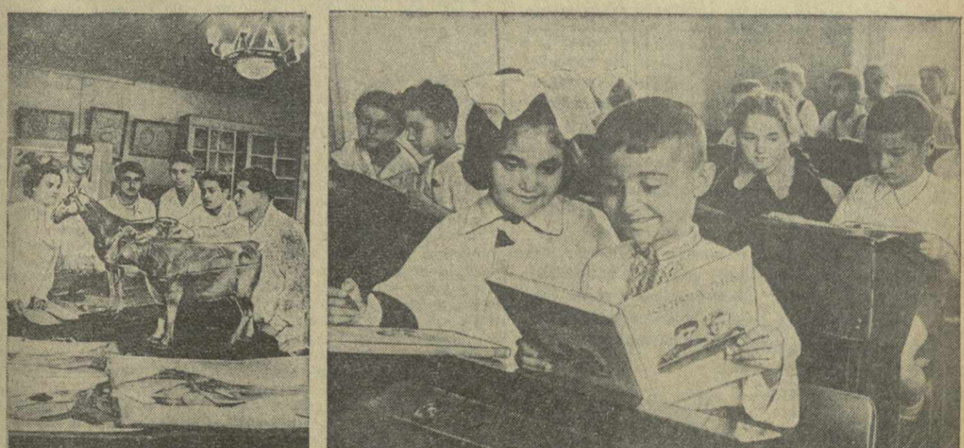
Вчера во всех школах и вузах нашей республики, как и всей страны, начался новый учебный год. На снимках: слева — занятия по нормальной анатомии животных в Грузинском зоотехнико-ветеринарном институте; справа — первокурсники 4-й тбилисской средней школы на уроке.

Самый значительный по объему раздел включает новые вокальные произведения. Ряд интересных материалов опубликован в разделах: «Инструментальная музыка», «Народное творчество», «Музыка для детей», «Эстрада», «Бальные танцы».