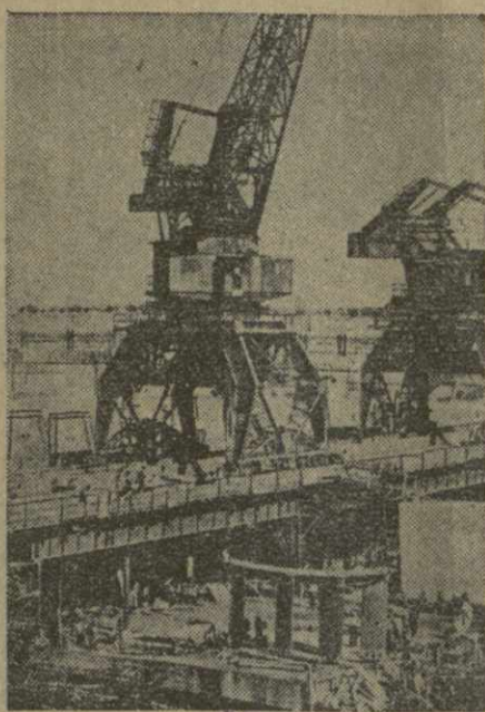
Новая Каховка. Строителя Каховского гидроузла приступили к монтажу первой турбины гидроэлектростанции.