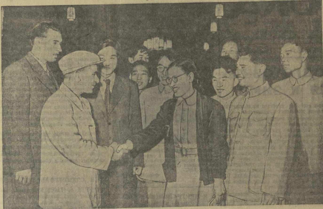
Во время пребывания в Москве профсоюзная делегация Китайской Народной Республики посетила Всесоюзную сельскохозяйственную выставку. На снимке: в павильоне Грузинской ССР...