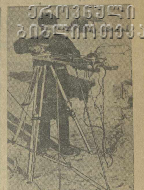
На дрейфующей научно-исследовательской станции «Северный полюс-3», руководимой Героем Социалистического Труда А. Ф. Трешниковым, ведутся научные работы по намеченной программе.

Гульришпи, 4. (Норр. «Зари Востока»). Колхозники артеда имени Леселидзе села Дранда Гульришпского района хорошо ухаживают за чайными плантациями, успешно выполняя задания по сбору зеленого чайного листа.