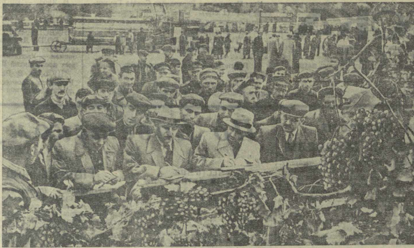
Районная сельскохозяйственная выставка в г. Телави. Делегация колхозников из Армянской ССР знакомится с лучшими сортами винограда.