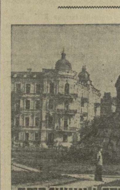
СТРАНИЦЫ ИСТОРИЧЕСКОГО ПРОШЛОГО

БМВБ, 23. (ТАСС). Предприятия Укрглавконсерва выработали с начала года продукции на 19 процентов больше, чем за это же время в прошлом году.