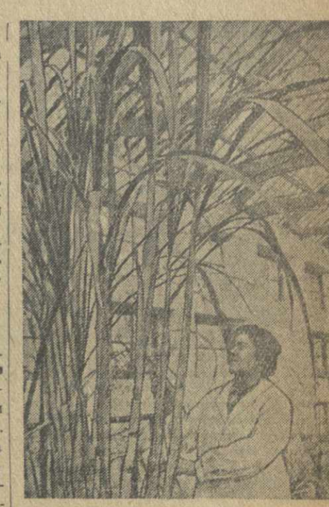
В Батумском ботаническом саду имеется 50 тысяч растений из разных мест земного шара.

30 агротехнических и зоотехнических курсов организовано в колхозах Амброурского района.