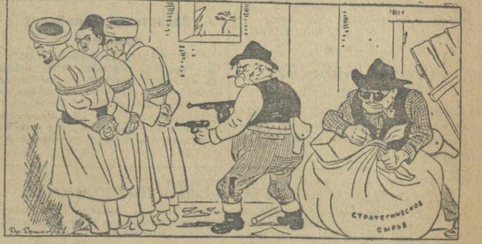
— Ни с места! Мы охраняем вашу безопасность... Рис. Бор. Ефимова. («Новое Время»).