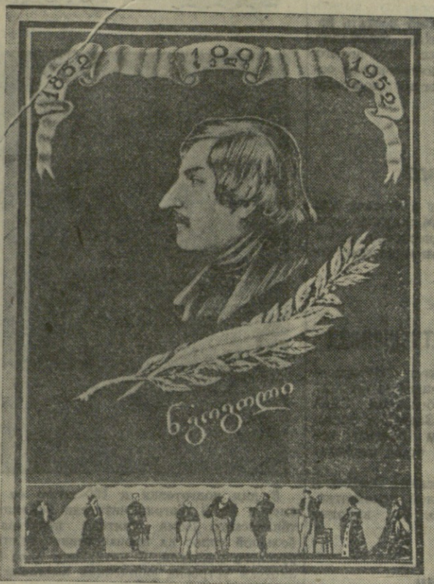
Государственным издательством Грузии к гоголевским дням выпущены из печати плакат работы художников В. Гиоргобани, Ш. Купрашвили и С. Кашиани.

Члены литературного кружка школы показали инсценировку повести «Шинель».