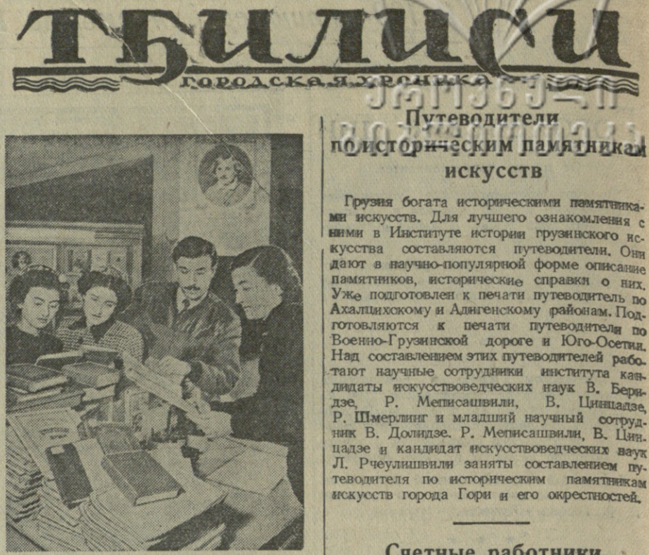
В дни подготовки к 100-летию со дня смерти Н. В. Гоголя читателя библиотеки Тбилисского Дома учителя привлекают большим спрос на произведения великого русского писателя. В читальном зале библиотеки устроена юбилейная выставка литературы.