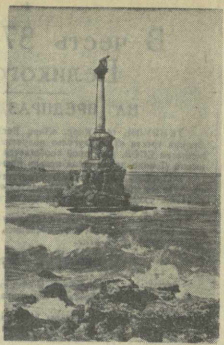
Севастополь. Памятник погибшим кораблям у Приморского бульвара.