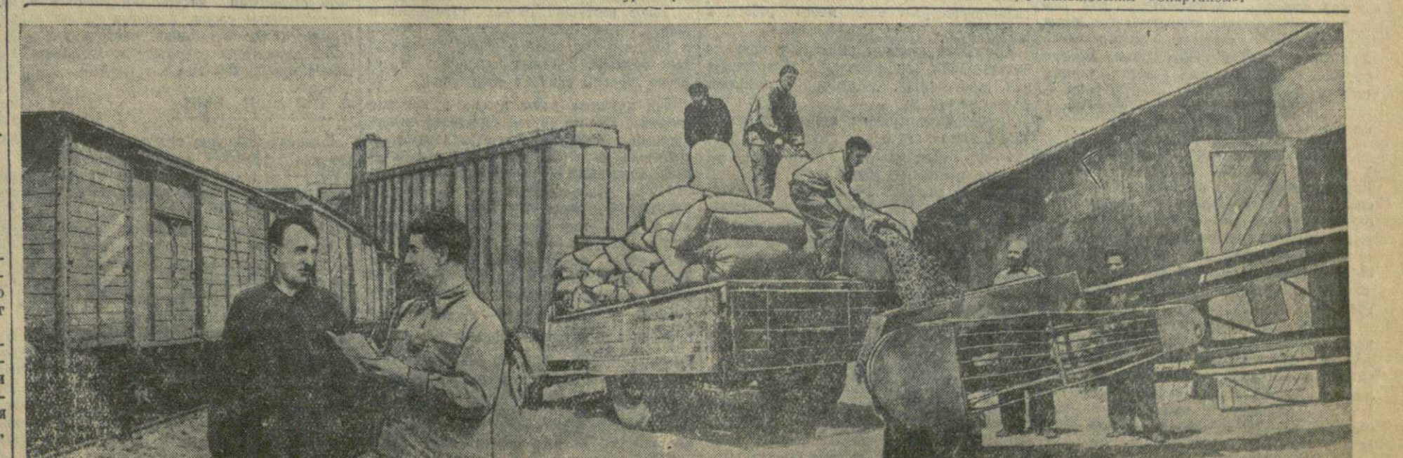
Навлягская (Тбилиси) база Заготзерно — самая крупная база в республике. Ежедневно она принимает сотни тонн пшеницы нового урожая. НА СНИМКЕ: разгрузка зерна, доставленного колхозом имени Берия села Гладни Гарубайского района.

Начались финальные игры на первенство страны по футболу по классу «Б». Как известно, в число команд, оспаривающих 1—9 места, вошли победители подгрупп: «Спартак» (Вильнюс), «Локомотив» (Харьков), Военно-Морские Силы, Дом офицеров (Тбилиси), «Красное знамя» (Иваново), «Динамо» (Алма-Ата), «Нефтяник» (Баку), «Буревестник» (Киев), «Торпедо» (Горький). Соревнования в этой подгруппе проводятся в два круга. Команды встречаются между собой на своем поле и на поле противника. Команда Тбилисского окружного Дома офицеров первую игру провела 17 июля в Ленинграде с футболистами Военно-Морских Сил. Встреча закончилась ничью 0 : 0. Второе состязание футболисты Дома офицеров провели 21 июля в Харькове с местной командой «Локомотив». С результатом 1 : 0 встречу выиграли харьковчане. Следующие календарные игры команда Дома офицеров проведет 27 и 30 июля в Тбилиси. 27 июля она встретится с киевским «Буревестником», а 30 июля — с вильнюсским «Спартак».