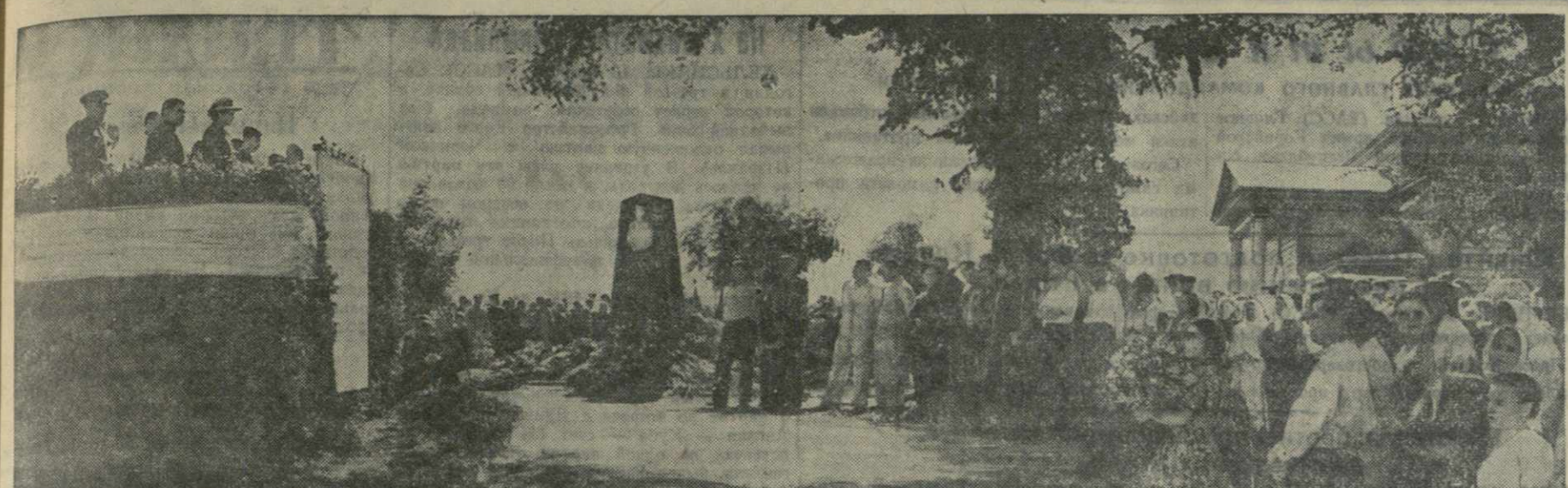
Податская область. Трудящиеся Миргородского района широко отметили 160-летие со дня смерти великого поэта грузинского народа Давида Гурамишвили. На снимке: митинг на могиле Давида Гурамишвили.