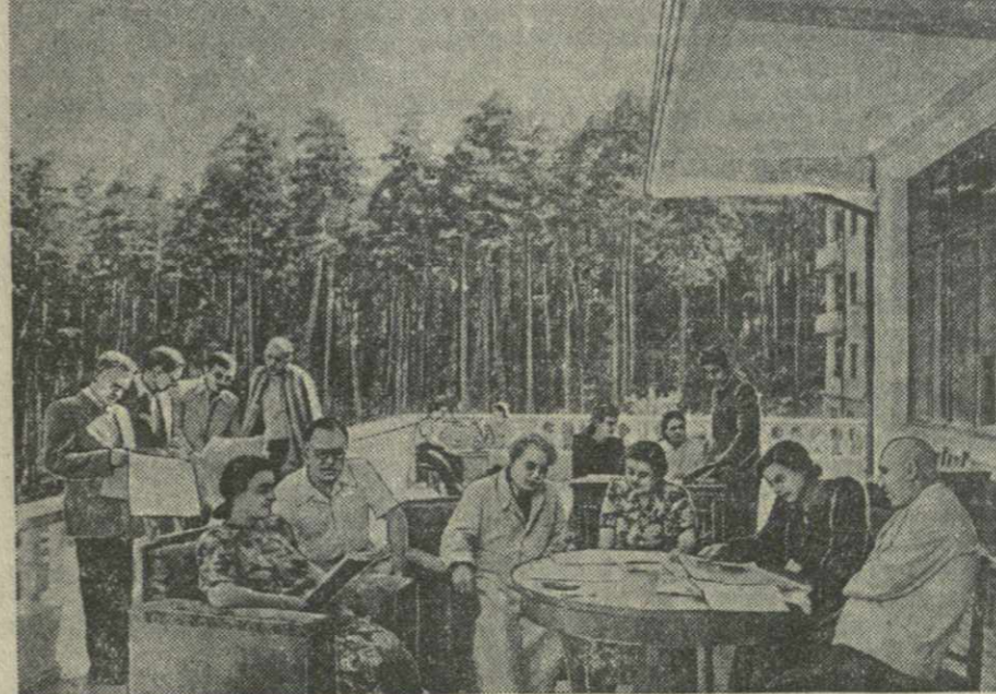
Боржом, Санаторий ВЦСПС в Ликани. На снимке: отдыхающие на веранде санатория.

Сейчас таганрогские металлурги трудятся над заказами других сталинских строек. С начала года строители Куйбышевской и Сталинградской гидроэлектростанций получили 450 тонн различных труб, десятки тонн листового металла. Много продукции раньше срока отправлено на строительные площадки Главного Туркменского, Южно-Украинского и Северо-Крымского каналов.