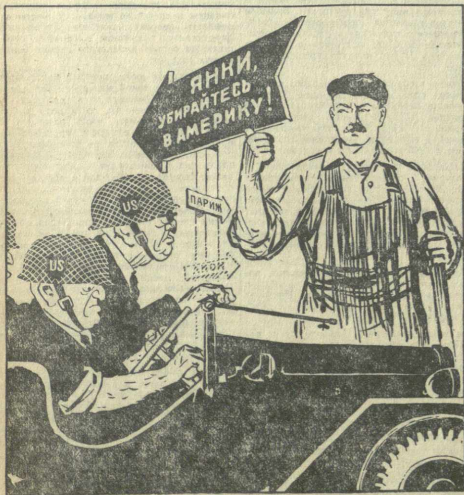
— Скажите, по какой дороге лучше проехать в Париж? — Лучше всего по этой!