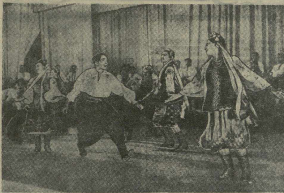
Выступление танцевального коллектива Государственного украинского народного хора под руководством лауреата Сталинской премии, заслуженного деятеля искусств Украинской ССР Григория Веревка.

Вечера, посвященные памяти классиков литературы двух братских республик, состоялись также в городской библиотеке, в клубах и читальных залах Орджоникидзе, Кахати, Пашви, Урти.