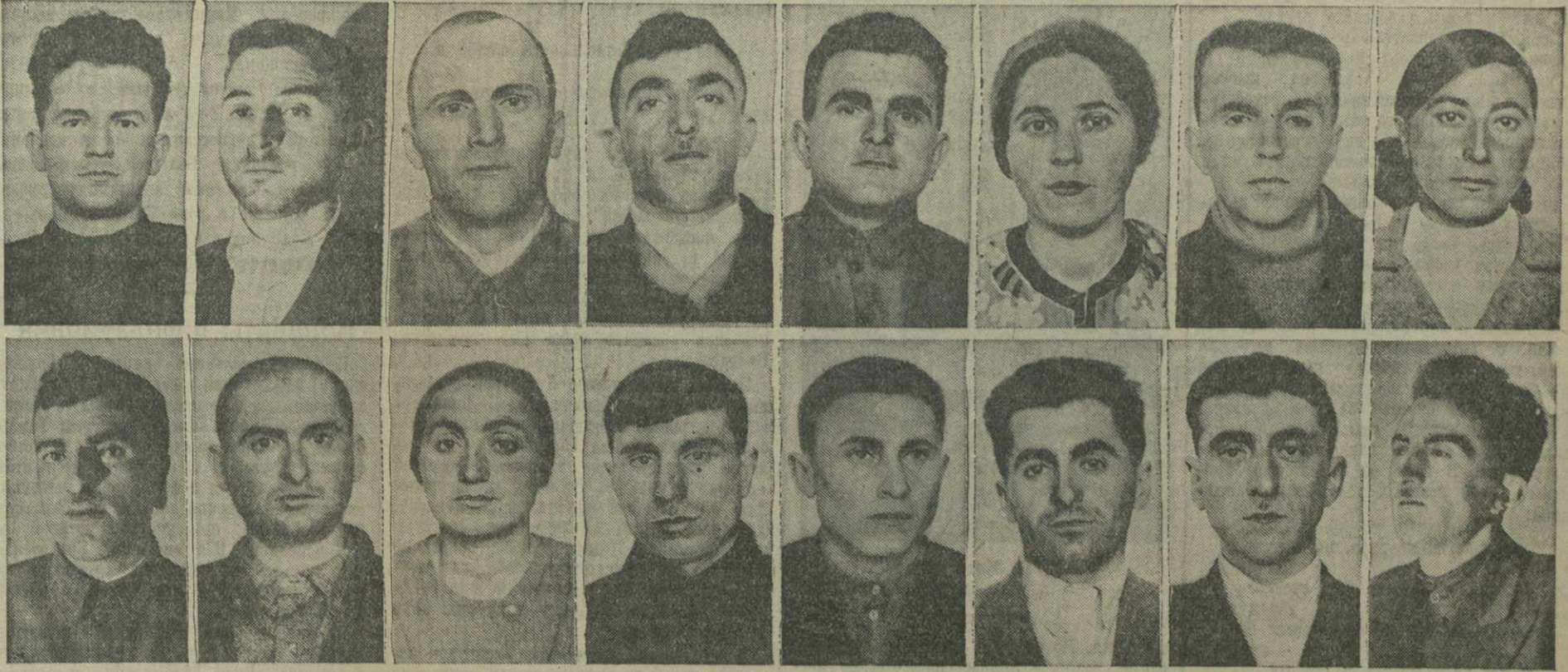
УЧАСТНИКИ СОВЕЩАНИЯ РАБОТНИКОВ ПЕЧАТИ СУБТРОПИЧЕСКИХ РАЙОНОВ ГРУЗИИ.