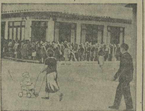
Очередь к продовольственному магазину в Виши (Франция).

С падением Керена три четверти старшей итальянской колонии в Эритрее находится в английских руках. Керен был последним серьезным барьером на пути к столице Эритреи — Асмаре и к весьма важному порту на Красном море — Массара, связанным с Кереном железной дорогой. Как полагают, третья часть итальянских сил в Восточной Африке численно от 60 до 70 тысяч человек была сосредоточена в районе Керена. По мнению военных кругов, продолжает агентство Рейтер, в Асмаре и Массара итальянцы не смогут оказать сильное сопротивление. Итальянское командование надеялось главным образом на Керен. Итальянцы собираются теперь оказать решительное сопротивление в районе Аддис-Абебы. Занятие англичанами Харара имеет большое значение, ибо связь Аддис-Абебы с морем через Джибути находится теперь под прямой угрозой.