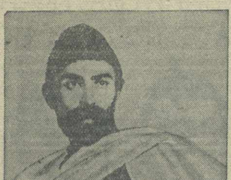
Н. Л. Хетагуров (Фотография 1895 г.)

Парское правительство жестоко преследовало Хетагурова за его революционные стихи, оно пыталось задушить его песню, огорчать его родного народа. Как «бунтовщика», как «чужака опасного для общественного спокойствия» оно дважды высладало его из пределов родного края, обрекая на суровую жизнь в