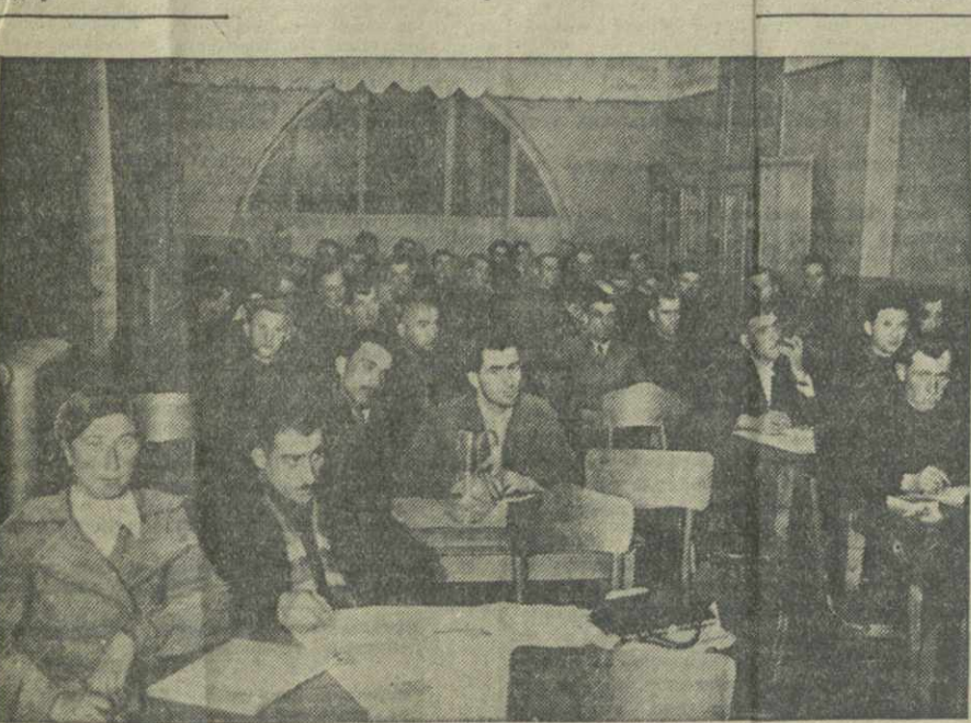
На совещании редакторов, членов редколлегий и селькоров районных и стеновых газет субтропических районов Грузии в кабинете рабора при редакции «Зари Востока».

С огромным воодушевлением встретили колхозники, — говорит председатель артели имени Орджоникидзе сел. Упалати т. Габелия, — постановление партии и правительства о дополнительной оплате труда. Наши колхозники вызвали на соревнование соседи колхоз имени Сталина. Совершенно подготовили почву для новых закладок чая и цитрусовых, мы теперь стремимся в том, чтобы также во-время провести закладку.