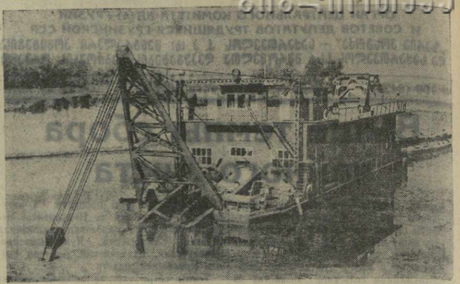
Сталинградгидрострой. На строительстве судостроительного канала Волга-Ахтуба. Земснаряд «502» вынимает грунт на трассе канала.

В последние полтора-два месяца к нам пришло много бывших строителей Волго-Дона. Они принесли с собой богатый опыт, умение быстро и четко решать сложные технические задачи. Многотысячный коллектив строителей, вооруженный первоклассной отечественной техникой, повелевально ошущая заботу партии и Правительства, построит в установленный срок грандиозную Сталинградскую ГЭС — одно из величайших сооружений сталинской эпохи. П. ТУЛЬНОВ, начальник политотдела «Сталинградгидрострой».