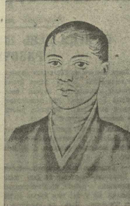
К народу, и с народом он говорит его языком — простым, понятным, свободным от тяжеловесных традиций древнегрузинской литературы. Этот язык поэт обрел в родном грузинском фольклоре, в источниках народной поэзии.

«Древний Шота, ритор мудрый, Возрастил на самом деле Древо прича с глубоким корнем, И плоды на нем зардели, Лишь трихми его обилье — и вдвойне Достигнешь чести...»