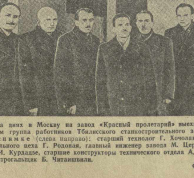
На днях в Москву на завод «Красный пролетарий» выехала с целью обмена опытом группа работников Тбилисского станкостроительного завода имени Кирова.

Наши московские друзья прислали нам ряд ценных описаний применяемых ими передовых методов труда.