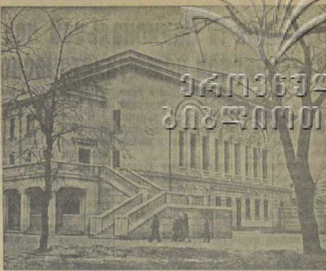
В нашей стране с каждым годом все шире развертывается культурно-бытовое строительство. Вступают в эксплуатацию новые дворы культуры, дома отдыха и санатории, сооружаются новые спортивные базы. В Харькове закончено строительство Дворца культуры добровольного спортивного общества «Красное знамя». В нем имеются: большой игровой зал, малый гимнастический, отдельный зал для занятий художественной гимнастикой, есть шахматно-шахматный клуб, бильярдная. Для тренировок и соревнований предназначен зал общей площадью в 700 квадратных метров. Здесь будет установлено несколько баскетбольных щитов передвижной конструкции. Одновременно смогут выступать и волейболисты. Не забыты и теннисисты, которые также смогут проводить здесь зимние тренировки. Санаторий Министерства черной металлургии строится в Сочи. В нем будут ежемесячно отдыхать и лечиться 280 металлургов. Одновременно со строительством жилых и лечебных корпусов ведется озеленение территории. На с ним к х: 1. На территории строящегося в Сочи санатория. 2. Новый Дворец физкультуры в Харькове.