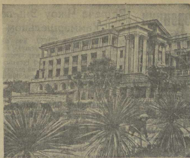
В нашей стране с каждым годом все шире развертывается культурно-бытовое строительство. Вступают в эксплуатацию новые дворы культуры, дома отдыха и санатории, сооружаются новые спортивные базы. В Харькове закончено строительство Дворца культуры добровольного спортивного общества «Красное знамя». В нем имеются: большой игровой зал, малый гимнастический, отдельный зал для занятий художественной гимнастикой, есть шахматно-шахматный клуб, бильярдная. Для тренировок и соревнований предназначен зал общей площадью в 700 квадратных метров. Здесь будет установлено несколько баскетбольных щитов передвижной конструкции. Одновременно смогут выступать и волейболисты. Не забыты и теннисисты, которые также смогут проводить здесь зимние тренировки. Санаторий Министерства черной металлургии строится в Сочи. В нем будут ежемесячно отдыхать и лечиться 280 металлургов. Одновременно со строительством жилых и лечебных корпусов ведется озеленение территории. На с ним к х: 1. На территории строящегося в Сочи санатория. 2. Новый Дворец физкультуры в Харькове.