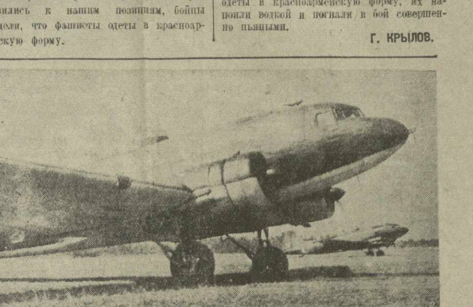
Действующая армия. На снимке: скоростные самолеты стартуют на фронт с военным грузом.

ЛОНДОН, 12 ноября. (ТАСС). Чехословаки, проживающие в Лондоне, отметили XXV годовщину Великой Октябрьской Социалистической революции массовым митингом.