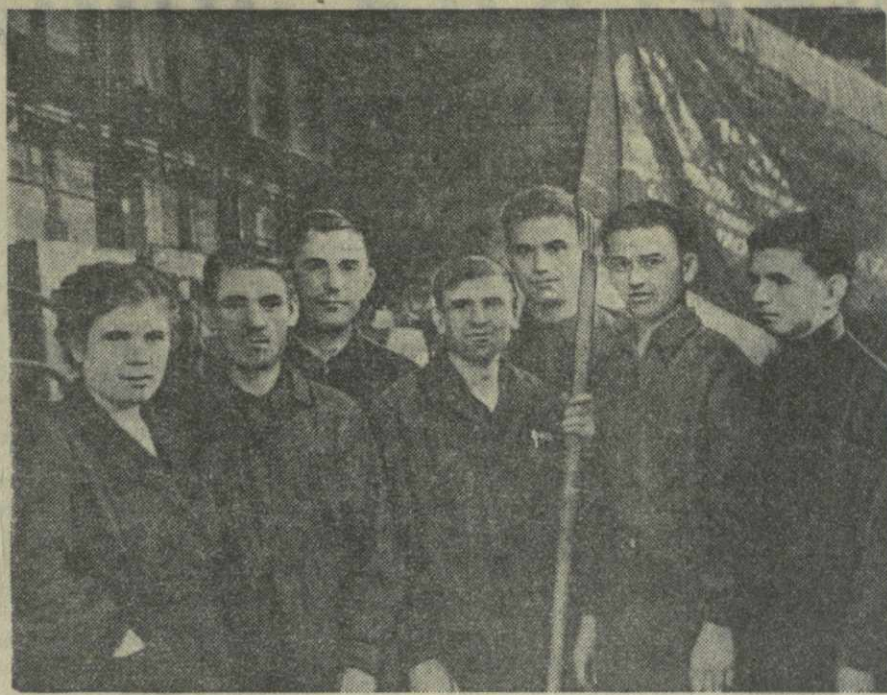
На Тбилиском станкостроительном заводе имени Кирова подведены первые итоги предоктябрьского социалистического соревнования. Первое место в соревновании основных цехов предприятия занял коллектив сборочного цеха № 11. Ему присуждено переходящее Красное знамя завода.