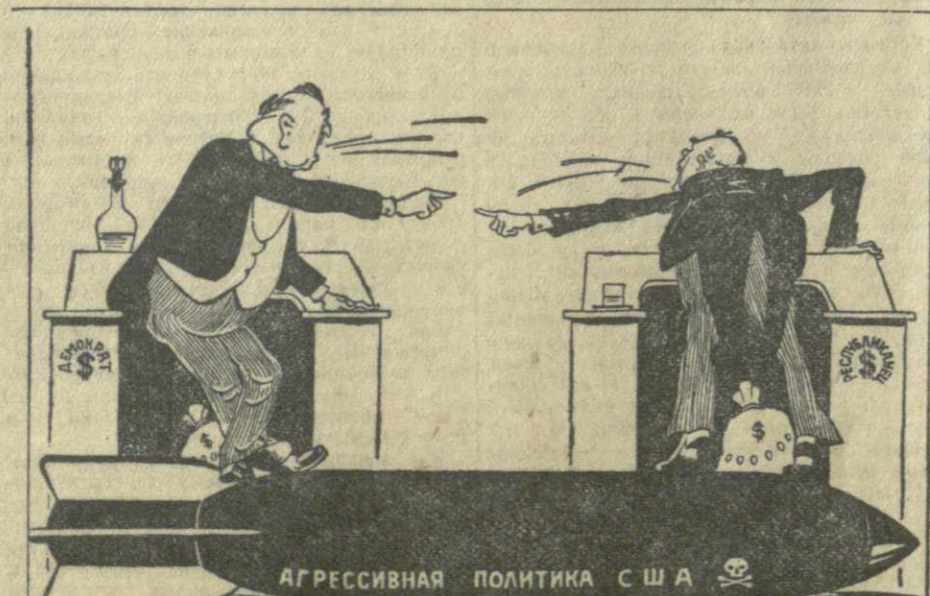
Рис. Г. Ломидзе.

Но, поскольку каждый из кандидатов стремится уловить возможно больше голосов за выборах, оба они, как указывалось в печати, преподносят избирателям «щедрые дозы сладких обещаний». При этом, однако, как Эйзенхауэр, так и Стивенсон старательно обходят наиболее волнующие простого американского избирателя вопросы или же ограничиваются по этому поводу расплывчатыми заявлениями, ни к чему их