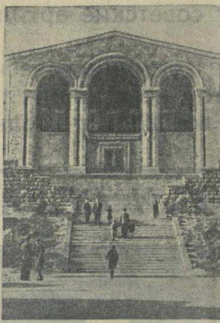
Ереван. Новое здание дома-музея великого армянского поэта Ованеса Туманяна.

Для чтения книг, снятых на пленку, в лаборатории микрофильмирования сконструирован портативный аппарат, увеличивающий изображение кадра до размеров книжной страницы.