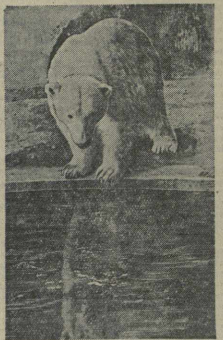
Скоро зима. По утрам ртуть в термометре держится ниже нуля, серебрятся инеем крыши домов.

Из всех обитателей зоопарка теперь, пожалуй, лучше всех чувствуют себя белые медведи. Настрадавшись от летней жары, эти жители севера с удовлетворением погружаются в бассейн с холодной водой.