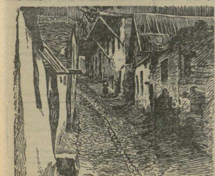
Старый Тбилиси. У подходов к бывшему Верийскому мосту.