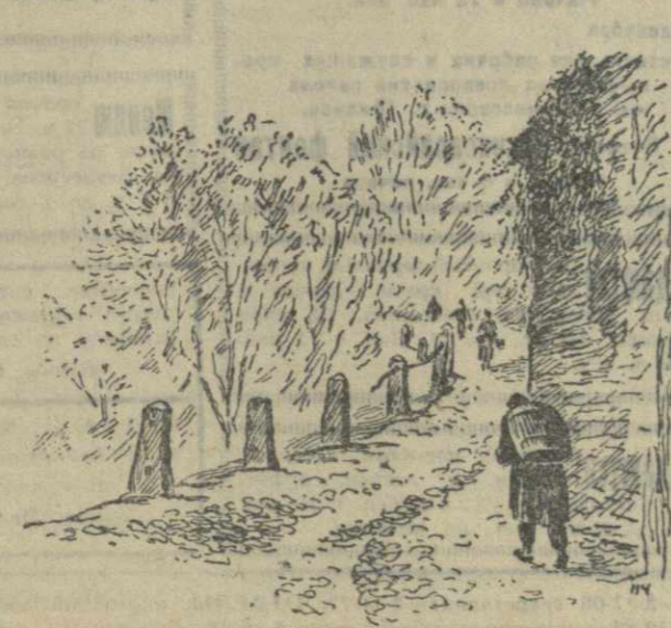
Худ. Н. Чернышков.